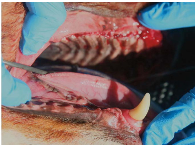
Deze hond had een zeer slecht gebit. De grote hoeveelheid tandsteen veroorzaakte zoveel ontstekingen dat bijna alle tanden getrokken moesten worden.

kunnen hoektanden en kiezen afbreken. Een afgebroken kies moet in veel gevallen getrokken worden. Afgebroken hoektanden kunnen, afhankelijk van de breuk, soms behouden blijven door een wortelkanaalbehandeling uit te voeren. Naast breken kunnen tanden ook afslijten. Tennisballen bijvoorbeeld, geven met een klein beetje zand hetzelfde effect als schuurpapier. Ook door kauwen op hard speelgoed kunnen de kiezen en hoektanden beetje bij beetje afslijten. Dit is over het algemeen een langzaam proces waardoor het leven van de tand zich steeds verder terugtrekt. Er blijven kleine afgestompte tanden over. Als het afslijten te snel verloopt kan het leven van de tand bloot komen te liggen. Dit doet pijn en er ontstaat een infectierisico. Op dat moment zal de tand zeker getrokken moeten worden.